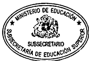
VÍCTOR ORELLANA CALDERÓN SUBSECRETARIO DE EDUCACIÓN SUPERIOR

ANÓTESE Y PUBLÍQUESE EN LA PÁGINA WEB DEL MINISTERIO DE EDUCACIÓN Y EN EL DIARIO OFICIAL CON CARGO AL MINISTERIO DE EDUCACIÓN.